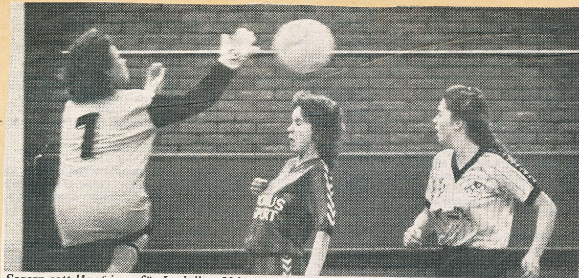
Segern satt långt inne för Ludvikas U-lag men avgörande kom i slutminuten.